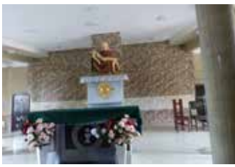
Die Kapelle der Theologiestudenten der Consoler in Ibadan, Juni 2016