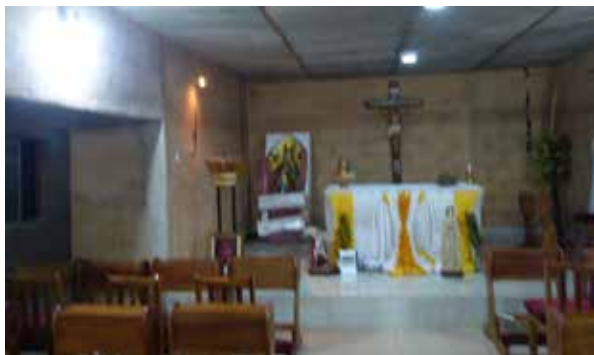
Kapelle der Little Lilies in Holy Land, Olo