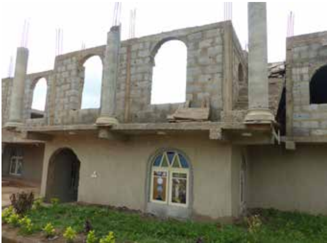
Die Kapelle (Krypta) und darüber die begonnene Kirche

Ihnen lohnen. Aber vielleicht können Sie auch noch weiterhin Barnabas unterstützen; nicht nur für die Dächer fehlt das Geld sondern auch für andere dringende Aufgaben, zum Beispiel die Flugkosten für Schwestern der Little Lilies, damit sie ihr Stipendium für ein Studium in Rom antreten können, für Schuhe, Ordenskleider, Bücher, Toilettenanlagen für Pilger usw. Auch für die Weihe der noch fehlenden Länder an das Kostbare Blut, jeweils am 14. September in Holy Land, Olo, braucht es noch Geld. Weil z. B. der Vertreter von Benin weder die Fahnen, noch das Podest