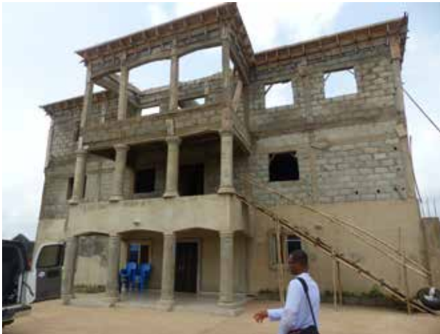
Das Konventgebäude der Theologiestudenten der Consoler in Ibadan, Juni 2016