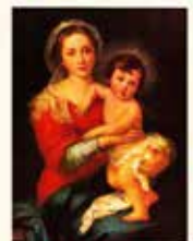
Apostolat der heiligen Mutterschaft